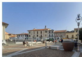
PUNTA PIANO TERRA

Le fioriere sono state riempite con gestroemie indaca e pitosforo nano come sempreverde alla base.